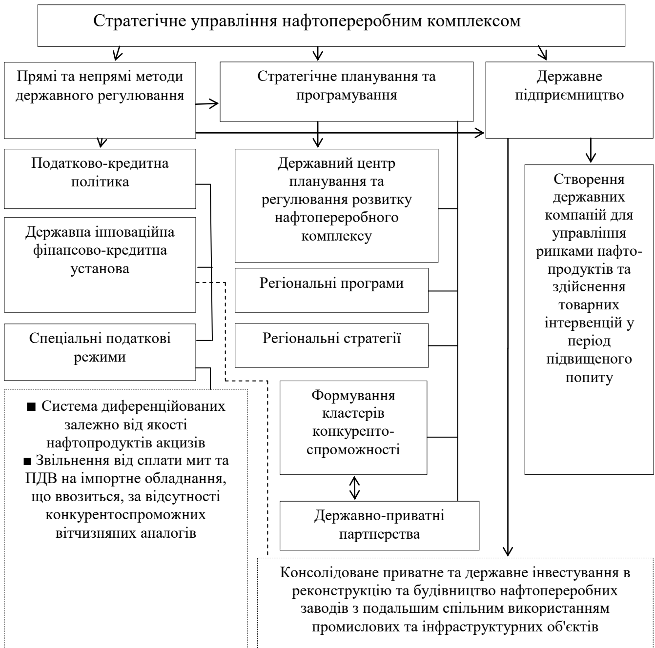
Рис. 1. Структурна модель стратегічного управління розвитком нафтопереробного комплексу

Такі пропозиції спрямовані на перетворення нафтопереробного комплексу на «локомотиви» регіонального зростання, забезпечення прямого (підвищення бюджетних надходжень, створення робочих місць та реалізації проектів інфраструктурної розбудови) та непрямого ефектів (зростання доходів суміжних сфер і галузей, підвищення доданої вартості економіки регіону, забезпечення сталого розвитку території). В рамках організаційної складової зазначеного механізму передбачено: створення сприятливих умов активного залучення малих підприємств до розширення сировинно-ресурсної бази нафтопереробки та впровадження інновацій, координація їх взаємодії з великими компаніями; формування Фонду сталого розвитку для акумулювання коштів від нафтовидобування та нафтопереробки для здійснення інвестицій у територіально-